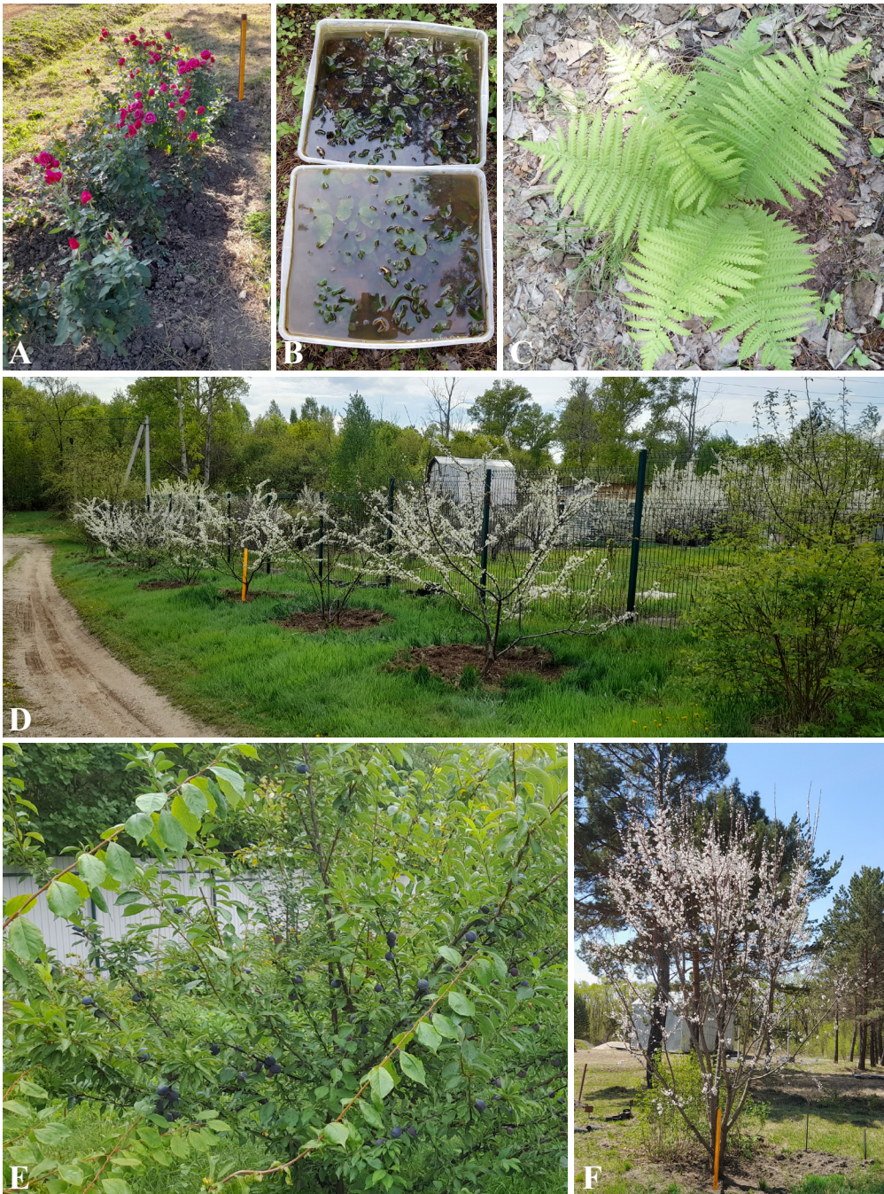
Рисунок 3. Растения, полученные in vitro , в открытом грунте или перед высадкой: роза 'Pink Floyd', сентябрь 2024 г. (А); Brasenia schreberi перед высадкой в водоем, июнь 2022 г. (В); Matteuccia struthiopteris , июнь 2022 г. (С); цветение слив посадки 2021 г., май 2025 г. (D); плодоношение сливы 'Благовещенский чернослив' посадки 2021 г., август 2025 г. (E); цветение Prunus mandshurica посадки 2016 г., май 2024 г. (F).

Figure 3. Plants obtained in vitro and planted outdoors or before planting: rose 'Pink Floyd', September 2024 (A); Brasenia schreberi before planting in a pond, June 2022 (B); Matteuccia struthiopteris , June 2022 (C); flowering plum trees planted in 2021, May 2025 (D); a fruiting plum tree 'Blagoveshchenskii chernosliv' planted in 2021, August 2025 (E); flowering Prunus mandshurica planted in 2016, May 2024 (F).