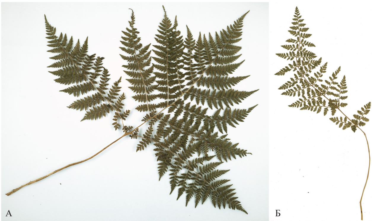
Рисунок 1. Вайи Pseudocystopteris spinulosa (Maxim.) Ching (А), Cystopteris fragilis (L.) Bernh. (Б) (здесь и далее без указания авторства приведены фото гербарных образцов)

Теневыносливые папоротники ( Pseudocystopteris spinulosa (Maxim.) Ching, Cystopteris fragilis (L.) Bernh., Diplazium sibiricum (Turcz. ex Kunze) Kurata и др.) характеризуются многократно рассеченными мезоморфными пластинками вай (Рис. 1).