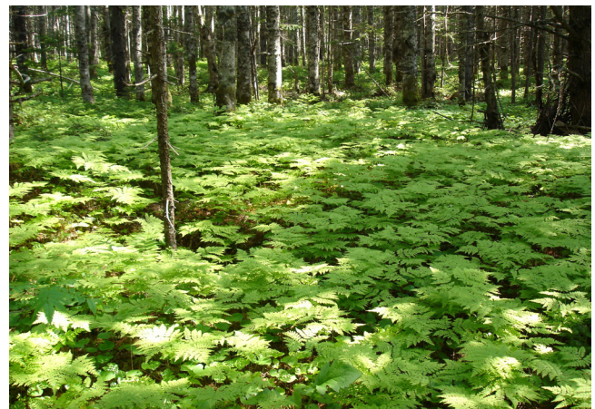
Рисунок 10. Leptorumohra amurensis в елово-пихтовом лесу (Южный Сахалин)

Ряд папоротников ( Leptorumohra amurensis , Coniogramme intermedia и др.) способны играть заметную роль в травяном покрове дальневосточных лесов, определяя один из подъярусов и являясь в нем доминантами. Доминирование Leptorumohra amurensis было отмечено нами в пихтовом лесу на о-ве Сахалин (Рис. 10).