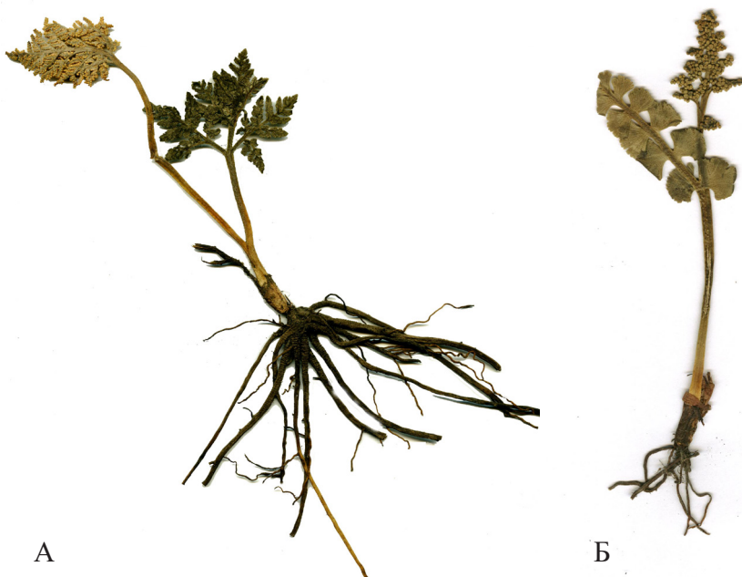
Рисунок 8. Botrychium robustum (Rupr.) Underw. (А), Botrychium lunaria (L.) Sw. (Б)

Представители этих родов отличаются медленным ростом, так, у Ophioglossum ежегодно открывается только один лист (Krinicyn, 2000). Один из видов сем. Офиоглоссовых – Ophioglossum thermale Kom. является термофилом и находит убежище, поселяясь у горячих источников, ключей, озер с горячей водой (Yakubov, Chernyagina, 2004). У го-