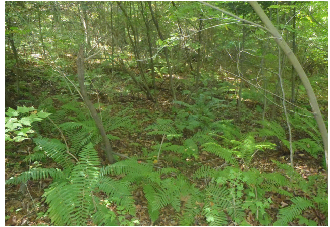
Рисунок 11. Dryopteris crassirhizoma в хвойно-широколиственном лесу (БСИ ДВО РАН)

На скалах, каменистых обнажениях, как правило, не образуется сомкнутых растительных сообществ. Папоротники в таких условиях либо образуют различные по численности микрогруппы, скопления, либо распределяются одиночно. Па-