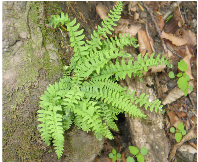
Рисунок 6. Woodsia polystichoides Eat.

Проведя анализ папоротников-эпилитов, Н.М. Державина (Derzhavina, 2015) выявила несколько особенностей, присущих этим растениям. Так, уменьшение размеров самих растений и их вай помогает папоротникам располагаться в