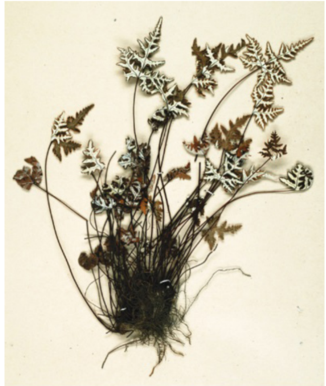
Рисунок 3. Aleuritopteris argentea (S.G. Gmel.) Fée Figure 3. Aleuritopteris argentea (S.G. Gmel.) Fée

Говоря в общем о морфологических и биологических особенностях лесных папоротников, следует отметить, что характерной чертой видов этой группы являются крупные значительно расчлененные мезоморфные вайи и короткие плотные или длинные подземные корневища (Храпко,