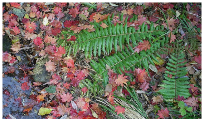
Рисунок 5. Полувечнозеленый папоротник Dryopteris crassirhizoma (фото О.В. Храпко)