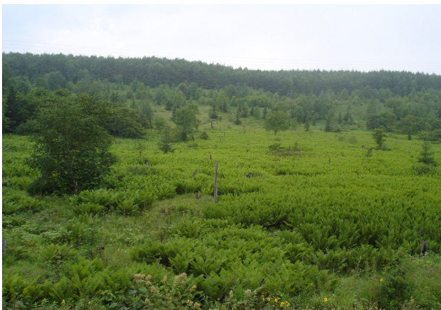
Рисунок 9. Osmundastrum asiaticum (Южный Сахалин)

Интересно заметить, что при сравнительной оценке роли папоротников в сложении растительности самых богатых во флористическом отношении растительных ценозов горнолесных провинций Сибири (Алтай) и Дальнего Востока (Сихотэ-Алинь) отмечена более тесная связь видов птеридофлоры с сообществами Алтая, у папоротников Сихотэ-Алиня эта связь размыта. В птеридофлоре Сихотэ-Алиня ведущую роль играют лесные виды, среди которых преобладают представители неморального ценоэлемента. В составе папоротников Алтая группы лесных и скальных папоротников почти равны по численности, среди лесных больше видов таежного ценоэлемента (Krylov, Khrapko, 1992).