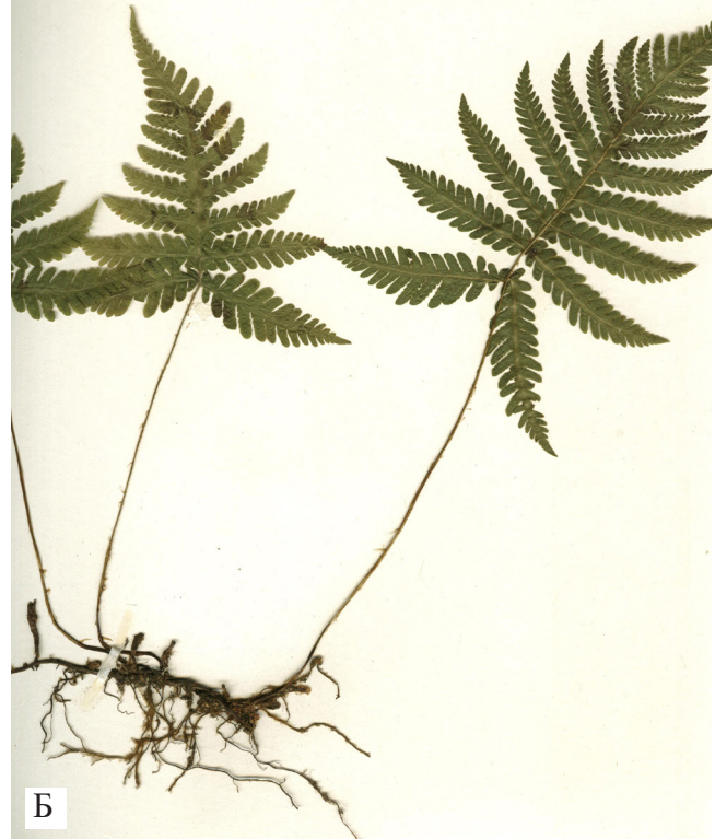
Рисунок 4. Развивающиеся вайи (А) Dryopteris crassirhizoma (фото Н.И. Курзенко), (Б) корневище Phegopteris connectilis .