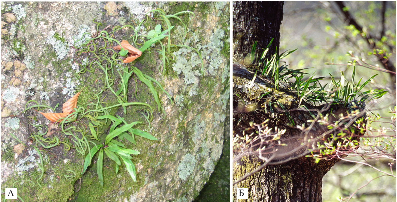
Рисунок 7. Lepisorus ussuriensis (Regel et Maack) Ching на скале (А) и на стволе дерева (Б)

Некоторые виды ( Polypodium sibiricum Sipl., Lepisorus ussuriensis ) встречаются в мохово-травяном покрове темнохвойных лесов. Это отмечено Л.А. Майоровой и Б.С. Петропавловским (Majorova, Petropavlovsky, 2017) при описании высокогорного пихтово-елового леса мелкопапоротнико-