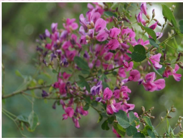
Леспедеца двуцветная Lespedeza bicolor