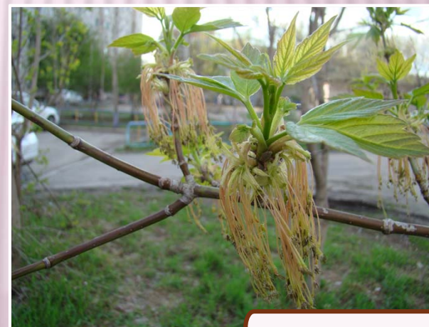
Клён ясенелистный Acer negundo L.