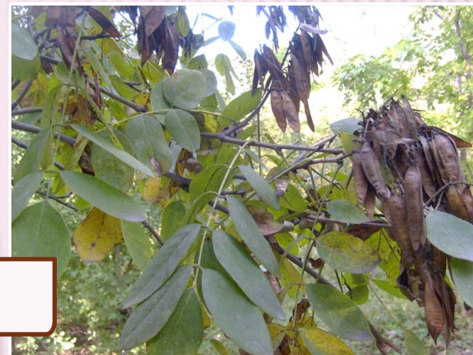
Маакия амурская Maackia amurensis